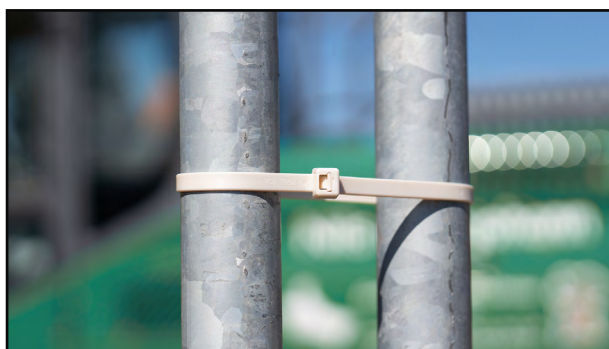
Bygg og anlegg