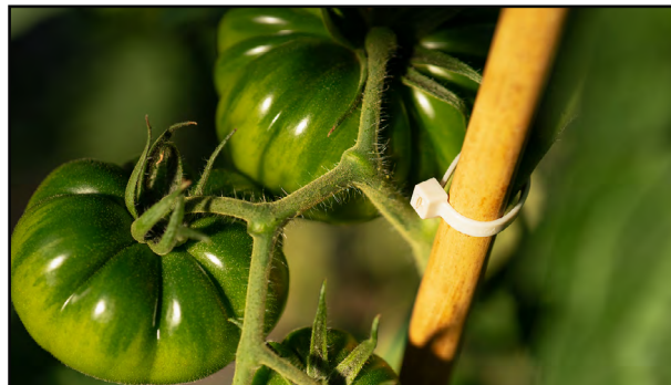
Hagearbeid og DIY prosjekter