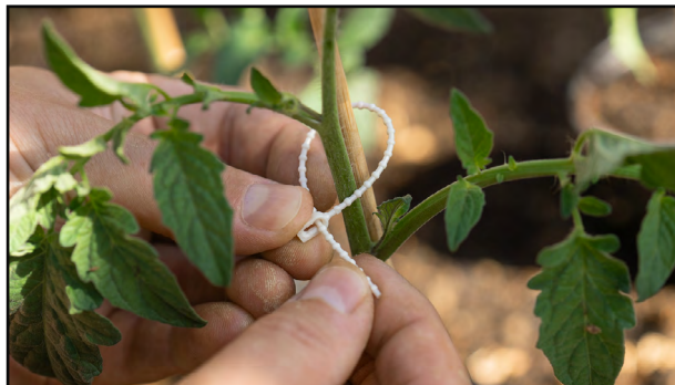
Jordbruk og landbruksindustri