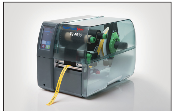
Printes utmerket med TT4030 termoskriver