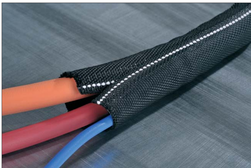
Helagaine Twist-In-FR er lett å identifisere pga. den hvite markeringstråden.

Helagaine Twist-In-FR er selvslukkende iht. UL 94 V0. og benyttes derfor i områder hvor det stilles høye krav til brannbeskyttelse, f.eks. i jernbane- luftfarts- og skipsbyggingsindustri.