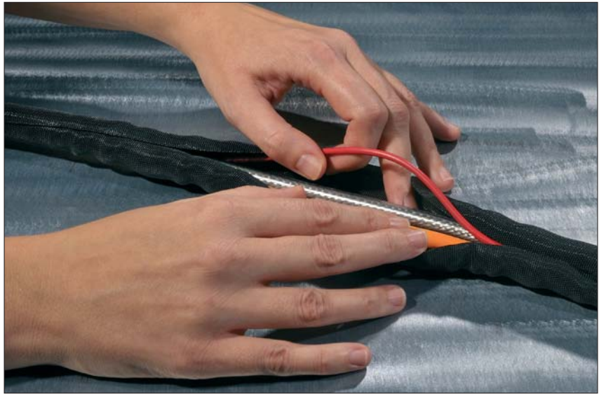
Med Helagaine Twist-In er kabelbunten lett tilgjengelig for vedlikehold, reparasjon og inspeksjon.

Helagaine Twist-In kan benyttes i mange områder innen maskinbygging, elektronikk og elektriske installasjoner.