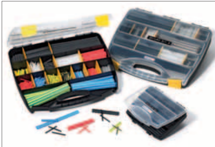
Rett krympeslange for hånden for enhver applikasjon: ShrinKit 321 Universal, ShrinKit 321-A og ShrinKit 321 Basic.

ShrinKit 321 leveres i 3 forskjellige sortimentskrin: ShrinKit 321 Universal, ShrinKit 321 Basic og ShrinKit 321-A (krympeslange med dobbel vegg.) Med krympeforholdet 3:1 kan disse produktene dekke flere størrelser på krympeslanger og er egnet til stort sett alle krympeslange-applikasjoner. Det er enkelt å velge rett produkt da hvert rom i skrinene er tydelig merket med størrelse, lengde og antall.