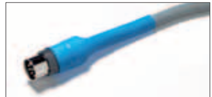
Krympeforhold 3:1 dekker et bredt bruksområde.

Sortimentskrinet inneholder et stort utvalg krympeslanger av varierende størrelse og farge. Det høye krympeforholdet på 3:1 dekker mange størrelser. ShrinKit 321 Universal dekker behov for størrelser med diameter fra 1 mm til 20 mm.