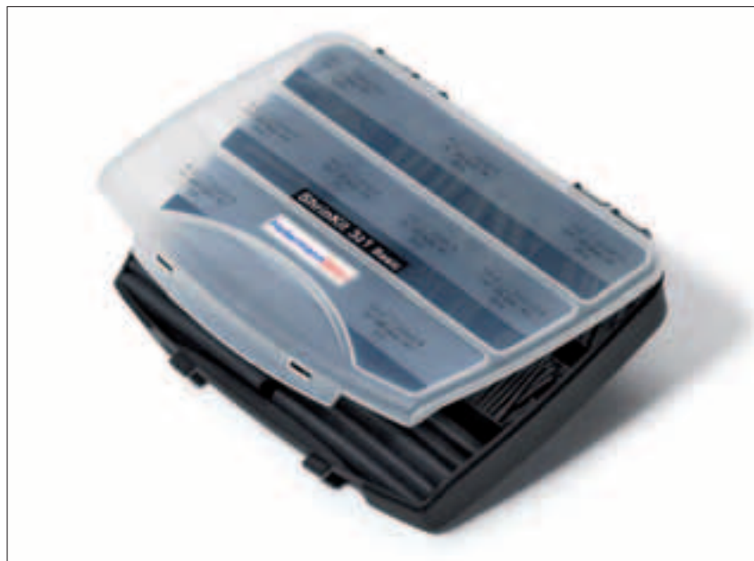
ShrinKit 321 Basic.

Dette sortimentskrinet inneholder et stort utvalg av sorte krympeslanger i 5 ulike størrelser og lengder.