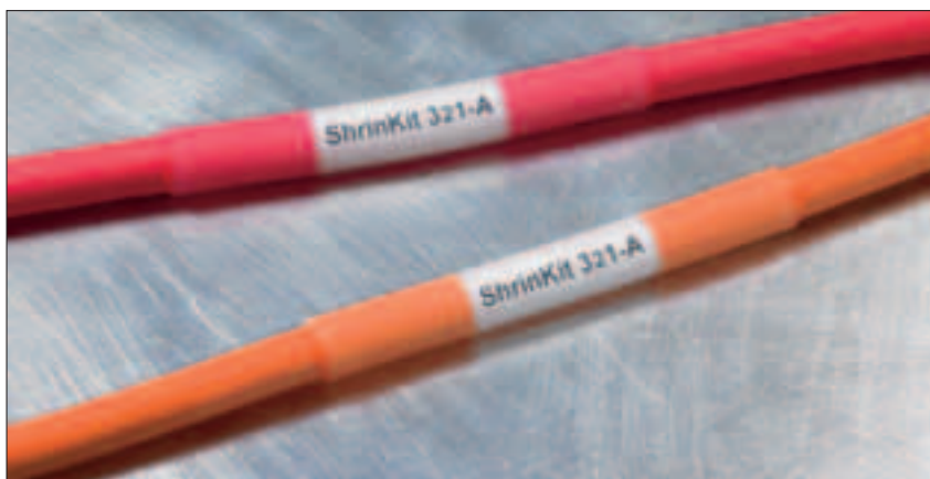
ShrinKit 321-A: Permanent beskyttelse av merking.

Dette sortimentskrinet inneholder et stort utvalg krympeslanger sortert i fire forskjellige lengder i 2 farger: sort og transparent.