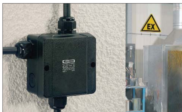
Boksene er testet med AXM metriske nipler.