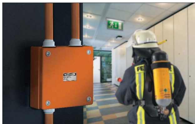
Serie FK - funksjonssikre bokser for optimal sikkerhet.