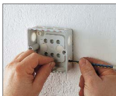
Serie DE for tidsbesparende montering.