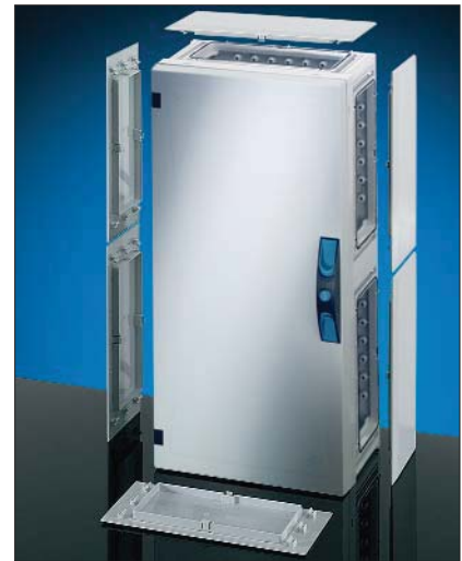
ENYSTAR FP 0331 med dekket grå dør.