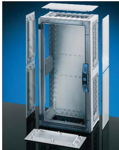
ENYSTAR FP 0311 med klar dør.

Merkespenning: AC/DC 690V. Merkestrøm: 250A.