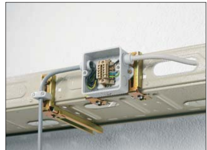
RD bokser, en tidsbesparende løsning.