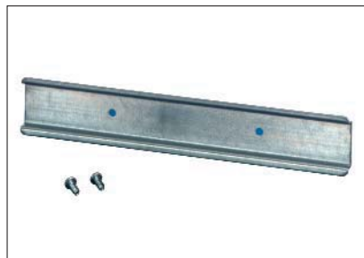
DIN skinne TS15 - TS35.