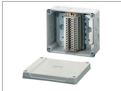
RK 9064 rekkeklemmeboks.

Kabelinnføringer: Via metriske svekninger.